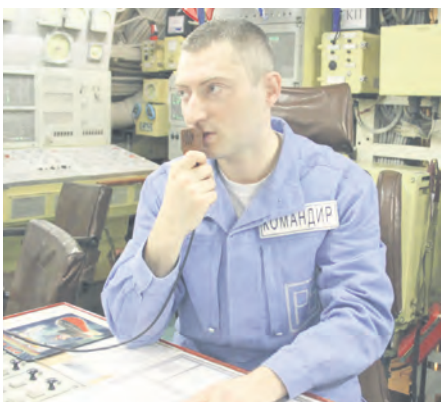
Командир РПКШ «Тула» капитан 1 ранга Михаил Морозов.

В незабываемой командировке в главную базу подводных сил у меня состоялось знакомство сразу с несколькими членами экипажа ракетного подводного крейсера стратегического назначения «Новомосковск» под командованием капитана 1 ранга Михаила Морозова, который в настоящее время выполняет задачи на одноплощадной подлодке «Тула».