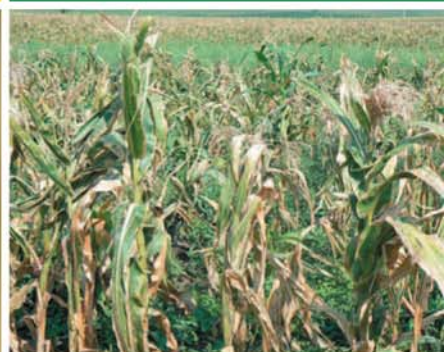
Засуха 2010: возмещение ущерба

Идею вмененного страхования сельскохозяйственных рисков, при котором полис становится условием получения всех видов субсидий со стороны государства, поддерживаю. А вот существующая сейчас система агрострахования меня не устраивает стр. 22