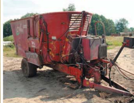
Необходимо усовершенствование инструментов агроэкспертизы