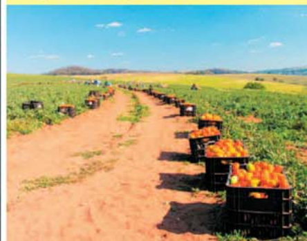
Кооперация — механизм оптимального использования ресурсов