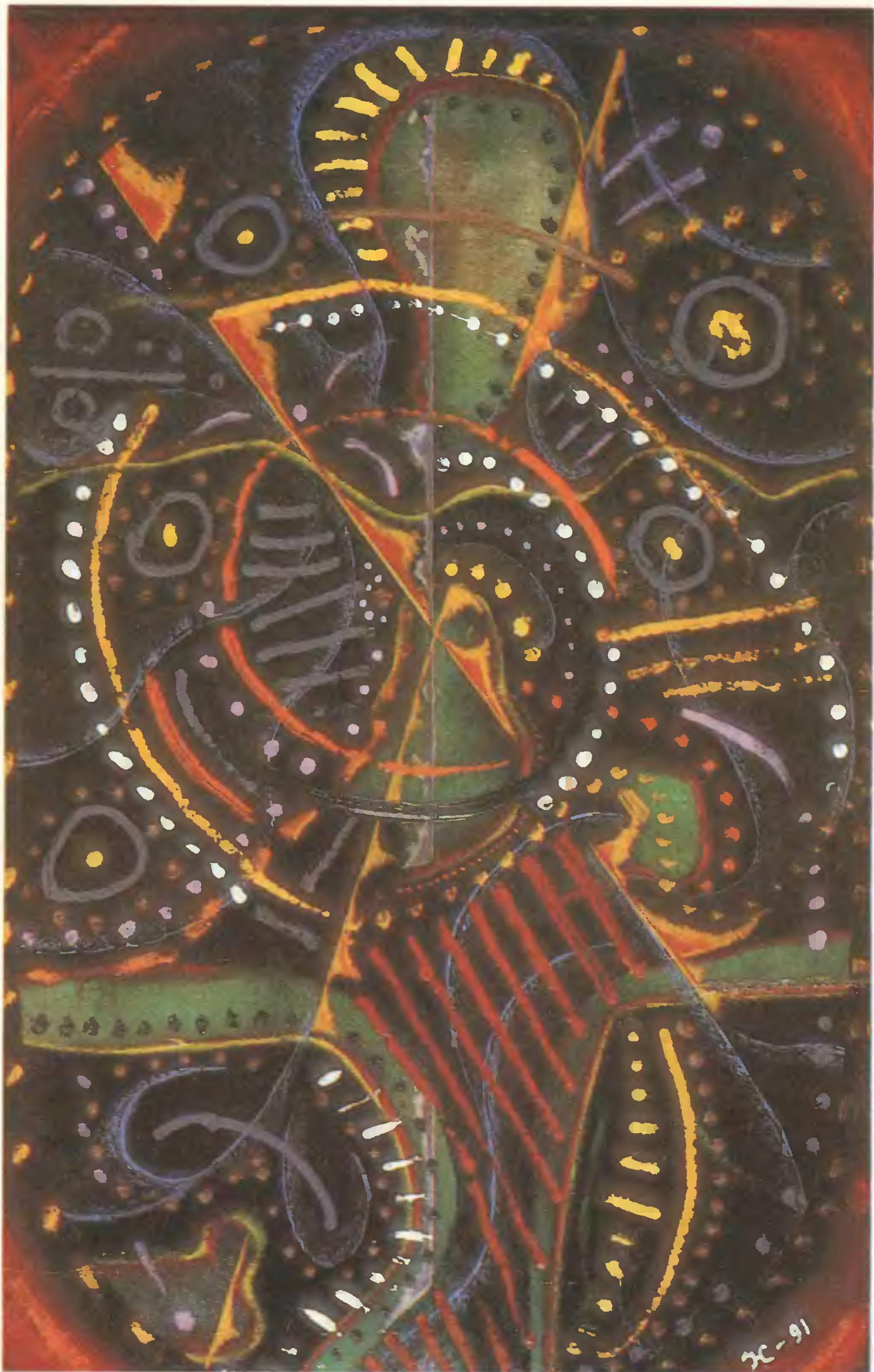
Ю. Сарафанов. «Композиция». 1991 г.