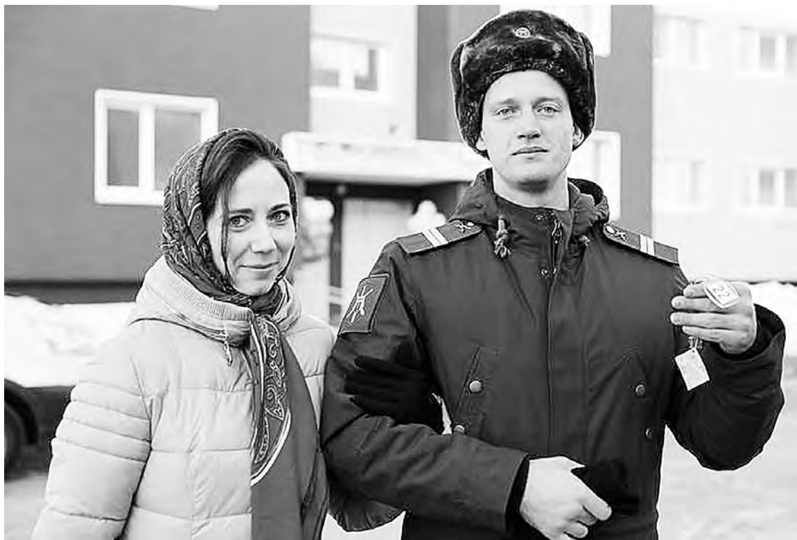
ПРЕСС-СЛУЖБА ПРАВИТЕЛЬСТВА САХАЛИНСКОЙ ОБЛАСТИ