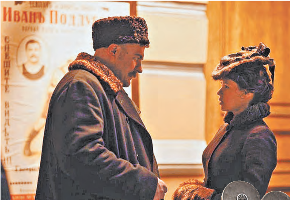
Большие проекты, такие, как «Поддубный» (на снимке) на фестиваль не поедут. А покажут те фильмы, которые не имели широкого проката