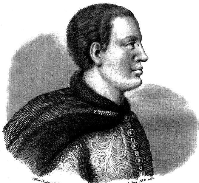
Портретъ Императора Александра II. В. И. Суриковъ. 1881 г.