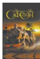
Сафон К. Р. Дворец полуночи / Пер. с исп. Е.Антроповой. М.: Астрель, 2012. — 318 с.

5 16-й год XX века. Калькутта. Лейтенант Пик, точно знающий, что жить ему осталось лишь несколько часов, приносит себя в жертву, чтобы спасти крошечного мальчика Бена и его сестру-двойняшку Шир... С 16-го года проходит 16 лет, и в городе появляется смертоносный огненный призрак. Что это за существо? И почему так упорно подбирается к близнецам?