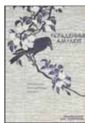
Японские волшебные сказки: В 2 т. Т.1: Украденный амулет; Т.2: Жемчужная ветвь / Пер. с англ. П.Стравца. М.: Издательский Дом Мещерякова, 2012. — 72 с. / 80 с.: ил.

6 Каждый год они идут к вершине священной горы Фудзиямы — их тысячи, и все хотят понять: что же за белый дым, будто парящий мост, тянется к небесному городу? Ответ на такой сложный вопрос можно найти разве что там — наверху, и еще здесь, в волшебных японских сказках.