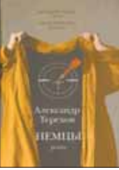
Терехов А. Немцы: Роман. М.: Астрель, 2012. — 572 с.

2 Эбергард, руководитель пресс-центра в одной из префектур города, умный и ироничный скептик, вполне усвоил законы чиновничьей элиты. Однако позиция конформиста оборачивается внезапным крушением карьеры. Личная жизнь тоже складывается непросто: все подчинено борьбе за дочь от первого брака. Острая сатира нравов доведена до предела.