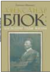
Иванова Е. Александр Блок: Последние годы жизни. СПб.: Росток, 2012. — 608 с.

1 За все время существования русской поэзии мало кто из поэтов был так любим при жизни, как Блок. Такое мнение однажды высказал поэт Георгий Иванов, а автор этой книги — доктор филологических наук, критик и текстолог Евгения Иванова — убеждена, что Блок до сих пор «остается наименее прочитанным из всех поэтов Серебряного века».