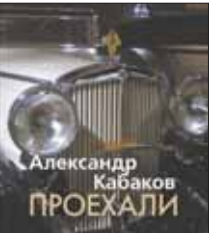
Кабаков А. Проехали: Машины прошлого века в воспоминаниях и картинках. М.: Астрель, 2012. — 156 с. 5000 экз. (п) ISBN 978-5-271-39217-7

Автомобиль не роскошь — сказали классики. Ну, это смотря какой. «Ушастый» «Запорожец» — это, понятное дело, даже не средство передвижения, а ведро с гайками. А вот «Роллс-Ройс», в котором можно сидеть, не снимая шляпы-цилиндра — дело другое. Но книга Александра Кабакова в основном посвящена восприятию автомобиля именно советскими гражданами. Характерная цитата: «Этот парень упал в советскую провинцию середины шестидесятых, как падает мелкая монетка путешественника в пыль чужой земли. <...> —