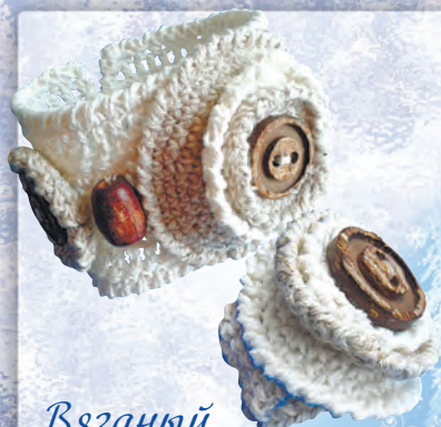
Вязаный комплект «Круш» с. 26