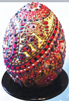
Пасхальный сувенир с. 2