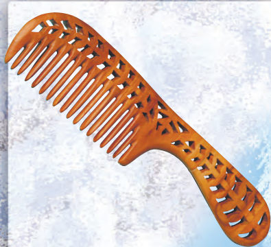
Деревянная расчёска с. 21