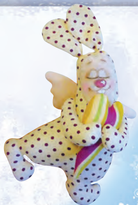
Сердечный заяц с. 6

Точечная роспись point-to-point вызывает всё больший интерес у художников, декораторов и просто любителей hand-made. Ею может заниматься любой человек! Вся технология заключается в том, чтобы наносить рисунок с помощью точек акриловыми контурами. Главное достоинство точечной живописи — её простота. Таким образом, создать свой шедевр сможет даже тот человек, который в жизни не держал в руках кисти и понятия не имеет, как правильно следует рисовать. В данной технике вы можете украсить любую поверхность. Заказать книгу можно на сайте www.for-m.ru .