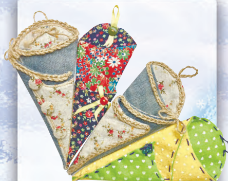
Органайзер для рукодельниц с. 16