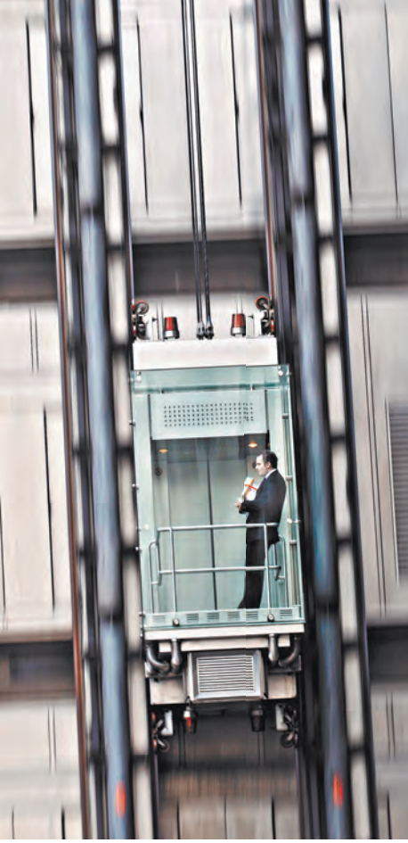
Все российские лифты будут внесены в специальный федеральный реестр.