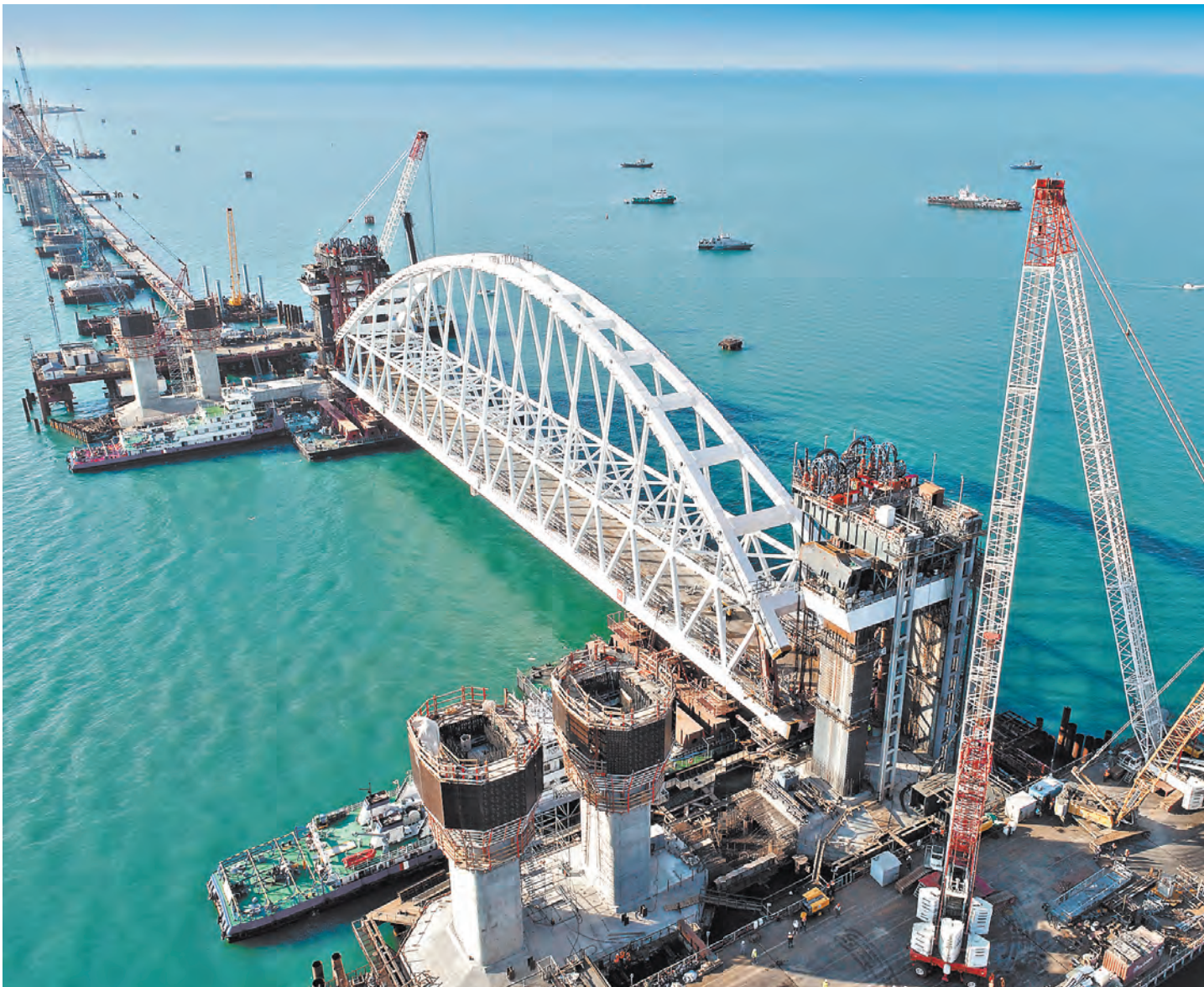
Вчера железнодорожную арку моста через Керченский пролив поставили на фарватерные опоры. РЖД и дорожники, которые участвуют в этом строительстве, по другим проектам являются главными получателями средств из Фонда национального благосостояния.

Игорь Зубков Правительство ужесточило контроль за средствами Фонда национального благосостояния (ФНБ), которые идут на финансирование мегапроектов, например, на строительство железных и автомобильных дорог.