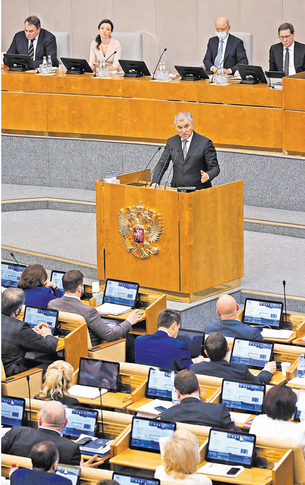
Вячеслав Володин: Повестка развития страны должна быть напартийной.

Несмотря на пандемию, в здании на Охотном Ряду удалось постепенно вернуть привычные форматы работы. Сейчас коллективный иммунитет депутатов достиг 95%, но в ходе сессии были дни, когда количество заболевших доходило до 43 человек. За последние три недели — один заболевший. «Подкрепи» прививками свой иммунитет, народные избранники работали и над стимулами для вакцинации всех остальных россиян. Самыми громкими законопроектными в осеннюю сессию стали внесенные правительством поправки о QR-кодах на транспорте и в общественных местах. По настоянию фракции «Единая Россия» инициативу о введении QR-кодов на транспорте сняли для дальнейшей доработки. Проект о посещении общественных мест по ковид-сертификатам депутаты все же одобрили в первом чтении, так как он оказался более подготовленным к рассмотрению.