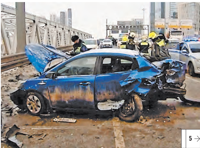
АГЕНТСТВО ГОРЯЩИХ НОВОСТЕЙ МОСКВА

Председатель Следственного комитета РФ Александр Бастрыкин поручил забрать из полиции две проверки по резонансным происшествиям в столице, с которыми сейчас разбираются сотрудники МВД