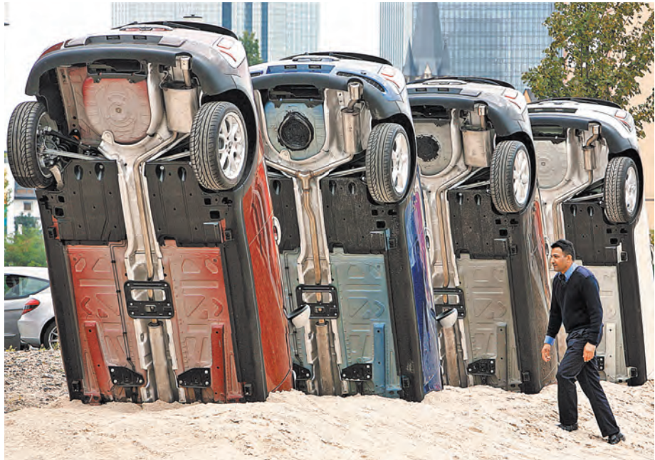
Новая машина теперь как клад — не только стоит дорого, но и походи найди, где она спрятана.

Раньше других уйдет отдыхать московский завод Renault, где традиционный коллективный отпуск начнется 29 декабря. При этом компания организовала дополнительные рабочие дни до конца рабочего года. АвтоВАЗ, по-прежнему испытывающий проблемы с комплектующими для Lada Granta, остальные модели тем не менее в декабре выпускает даже сверхурочно. В последнее время их производство организовано не только по субботам, но и по воскресеньям.