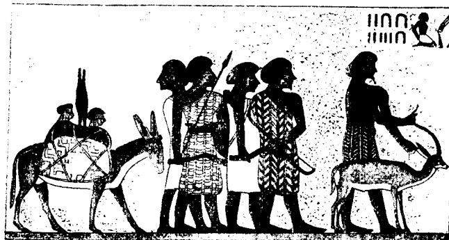
Евреи, нарисованные на памятникахъ, оставленныхъ древними египтянами.

Расскажемъ, какъ жилъ народъ египетскій, и богатый и бѣдный, какимъ богамъ и какъ онъ поклонялся.