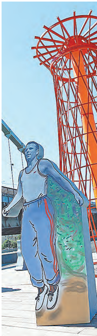
Юрий Гагарин родом из-под Гжатска, откуда и поехал поступать в Люберецкое ремесленное училище.