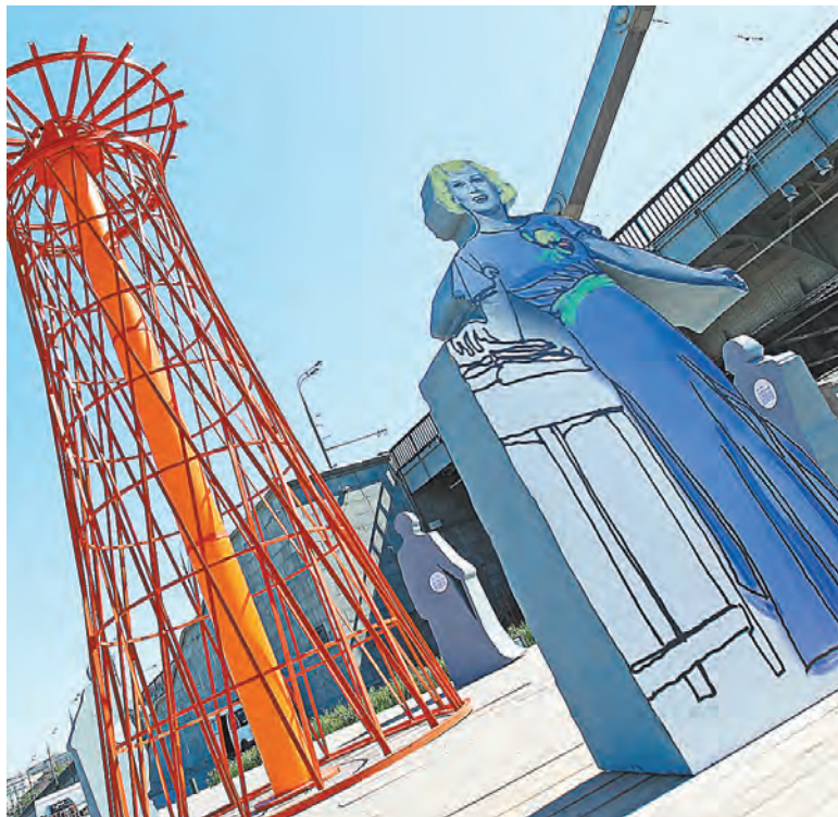
Любовь Орлова родилась и выросла в подмосковном Звенигороде.