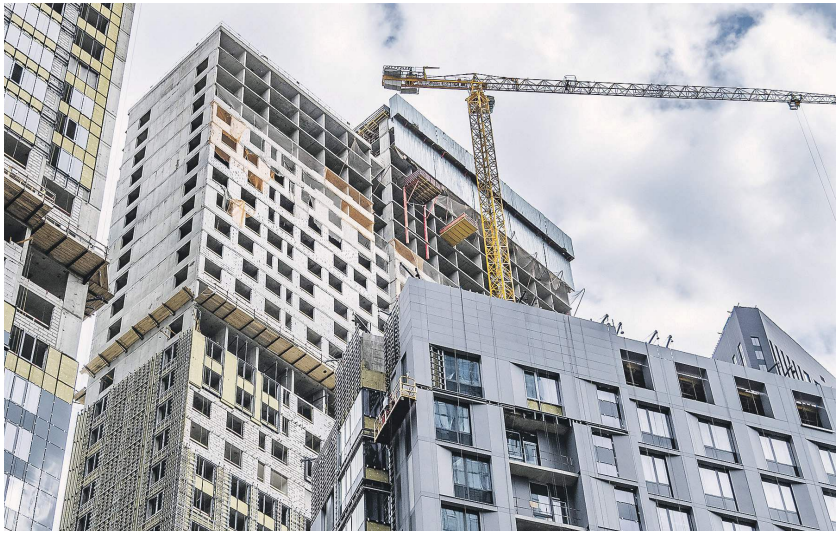
Константин Кошкин / «Известия»