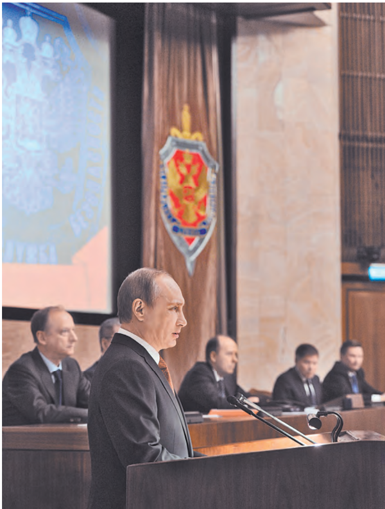
Выступая на коллегии ФСБ, президент назвал ключевой задачей Службы борьбу с экстремизмом и терроризмом.

«Важно работать на упреждение, особое внимание уделить выявлению и пресечению каналов финансовой и ресурсной поддержки бандподполья, вскрывать его связи с зарубежными террористическими группировками и спонсорами», — поставил чекистам задачу глава государства.