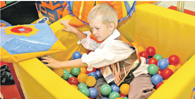
Новые детсады оснастят современным игровым оборудованием.