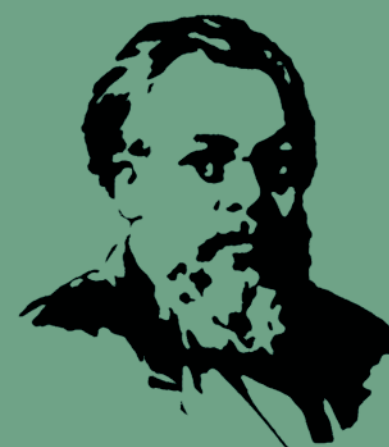
С. П. Боткин