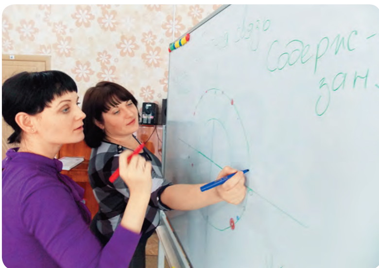
Фрагменты занятий в рамках работы по педагогическому просвещению молодых специалистов