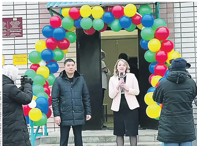
Для жителей Троицкого открытие детского сада стало праздником.