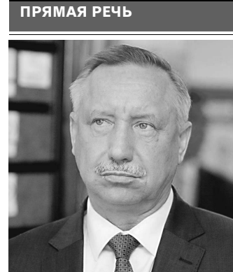
Александр Беглов, врио губернатора Санкт-Петербурга:

Свою лепту в цифровизацию Арктики внесет и Петербург. Здесь появится новый научно-образовательный центр мирового уровня в сфере сетей 5G и перспективных сетей 2030. Сети нового поколения уже начали тестировать. Телекоммуникационный оператор МТС и компания Huawei запустили в Кронштадте первую в России пользовательскую сеть связи 5G. Сеть нового поколения охватит почти весь город и будет доступна пользователям 5G-смартфонов. В ней тестируют инновационные технологии: решения для Smart City, беспилотного транспорта, интернета вещей, телемедицинских услуг. При подключении к сети 5G коммерческий смартфон продемонстрировал в Кронштадте пиковую скорость 1,2 гигабита в секунду. ●