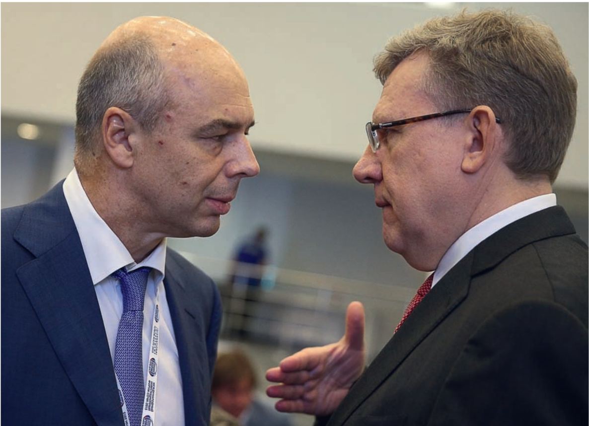
Алексей Кудрин и Антон Силуанов по-разному оценивают степень зависимости России от нефтяной конъюнктуры.

Министерство промышленности и торговли готовит законопроект, позволяющий выращивать опиумный мак для производства лекарств, но в промышленных масштабах. Для частного использования выращивать опиаты будет запрещено.