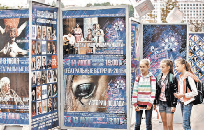
Гостей фестиваля ждут 18 концертных программ, включая ночные концерты и шесть «солнышков» звезд российской эстрады.

театра еще не прозвучали аккорды концерта открытия, а один из крупнейших культурных форумов планеты уже установил рекорд. Его участниками станут посланцы 42 стран. Рядом с главной сценической площадкой пришлось дополни-