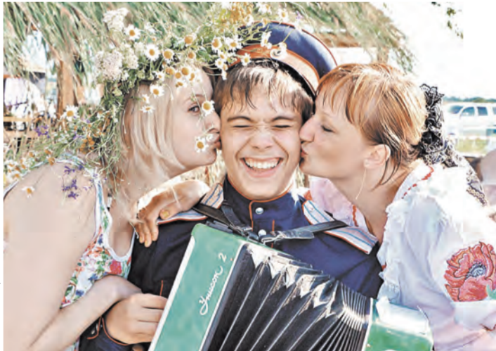
Фестиваль уже стал символом дружбы народов, живущих на Дону. Здесь проживает более 30 тысяч этнических белорусов.

День Ивана Купалы у славян — праздник летнего солнцестояния. С принятием христианства он приурочен ко дню Иоанна Крестителя, который приходится на 7 июля по новому стилю. По традиции, на Купалу устраивают гуляния, которые продолжаются до утра и сопровождаются народными обрядами.