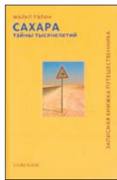
Пэлин М. Сахара. Тайны тысячелетий / Пер. с англ. А.Романова. М.: СЛОВО/SLOVO, 2011. — 360 с.: ил.

5 Знаменитый путешественник, президент Королевского географического общества Великобритании, участник шоу Монти Пайтон, писатель и телеведущий Майкл Пэлин рассказывает о том, как проделал путь в 16 000 километров, пытаясь разгадать тайну Сахары и показать миру необычное лицо великой пустыни.