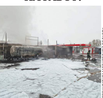
ПРОКУРАТУРА МОСКОВСКОЙ ОБЛАСТИ

Сильный взрыв произошел в понедельник утром прямо у забора аэропорта «Шереметьево». В микрорайоне Клязьма-Старбеево подмосковного городского округа Химки взорвалась и загорелась газовая заправка. Как стало известно «МК», ЧП случилось около 8 часов утра. Произошла разгерметизация емкости с пропаном, а последовавший затем пожар спровоцировал взрыв резервуара для хранения газа — газгольдера. Пламя охватило палеты, бытовки и пять автомобилей. Своими впечатлениями о случившемся поделились пострадавшие.