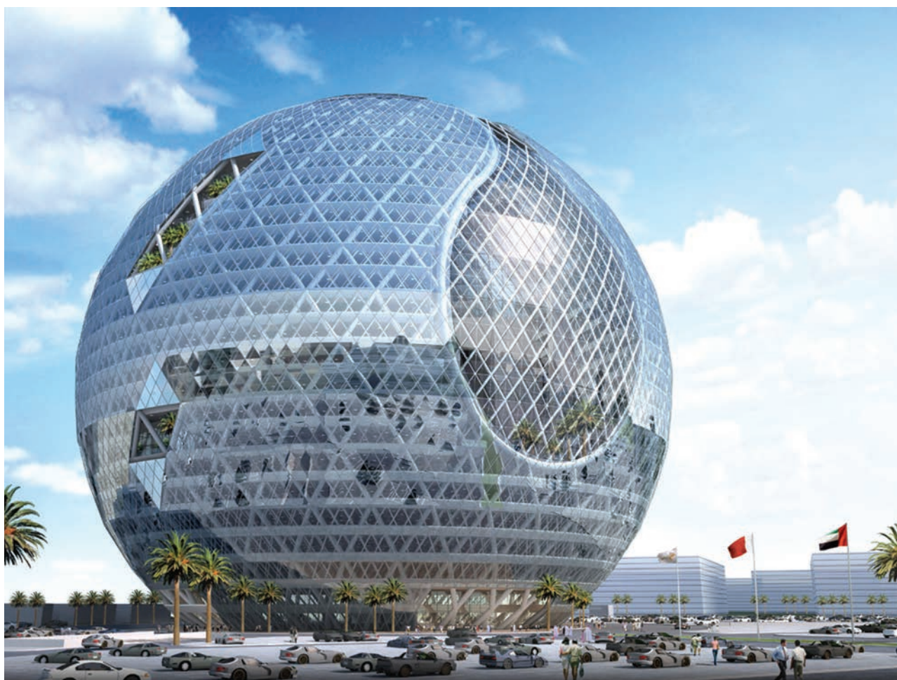
Техносфера для технопарка в Дубае.

В настоящее время в мире существует множество разнообразных форм технопарков. В их числе выделяют научные, технологические и исследовательские парки, инновационные, инновационно-технологические и бизнес-инновационные центры, центры трансфера технологий, инкубаторы бизнеса и технологий, виртуальные технополисы и др.