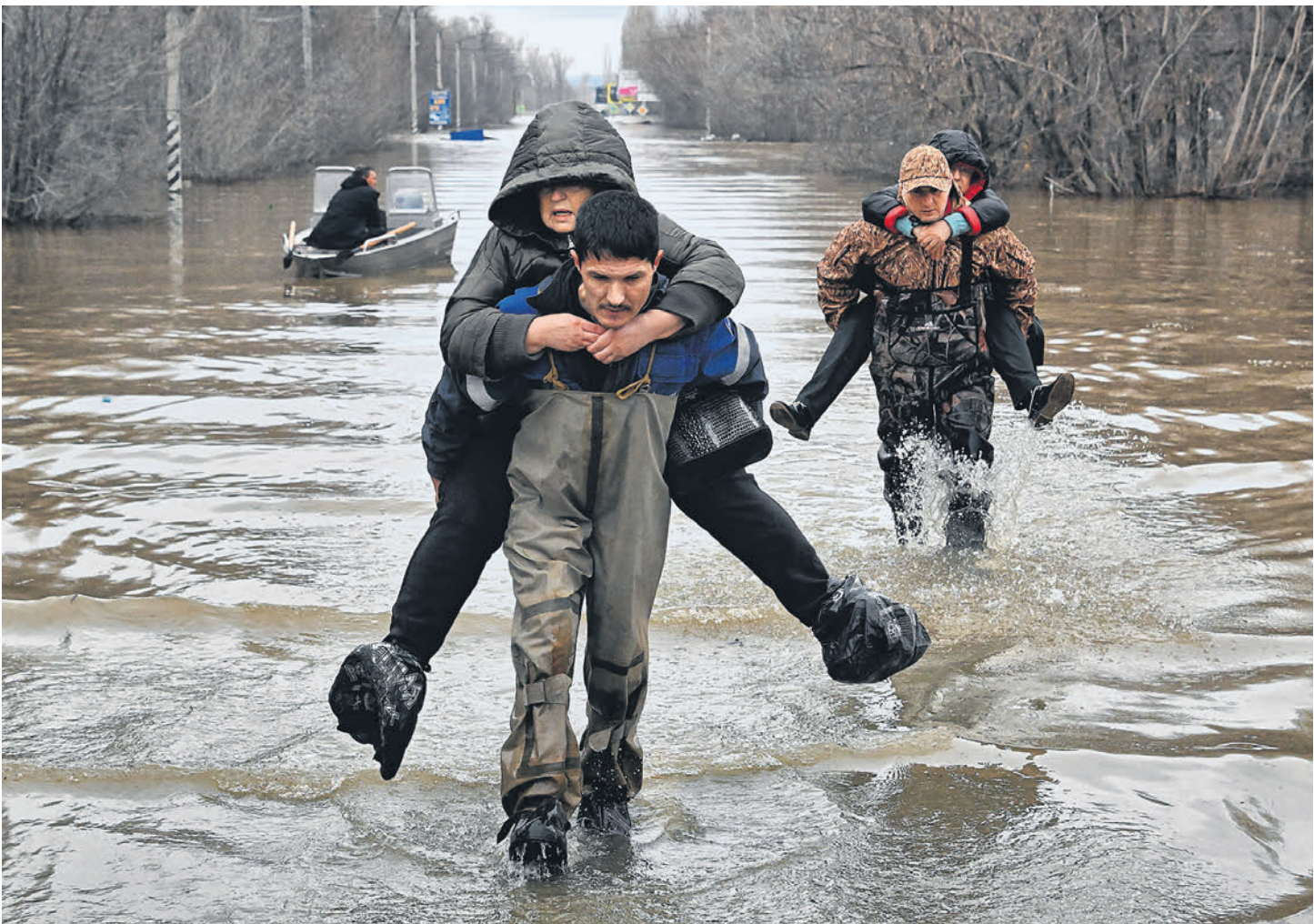
В понедельник жители Орска ушли из районов, куда пришла вода

Вадим говорит, что в 6-м микрорайоне довольно много жителей высоких этажей отказываются уезжать. Таким «останцам» волонтеры на лодках подвозят продукты.