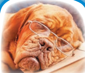
Как СПЯТ животные