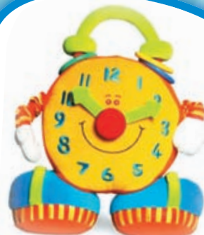
Кто придумал БУДИЛЬНИК