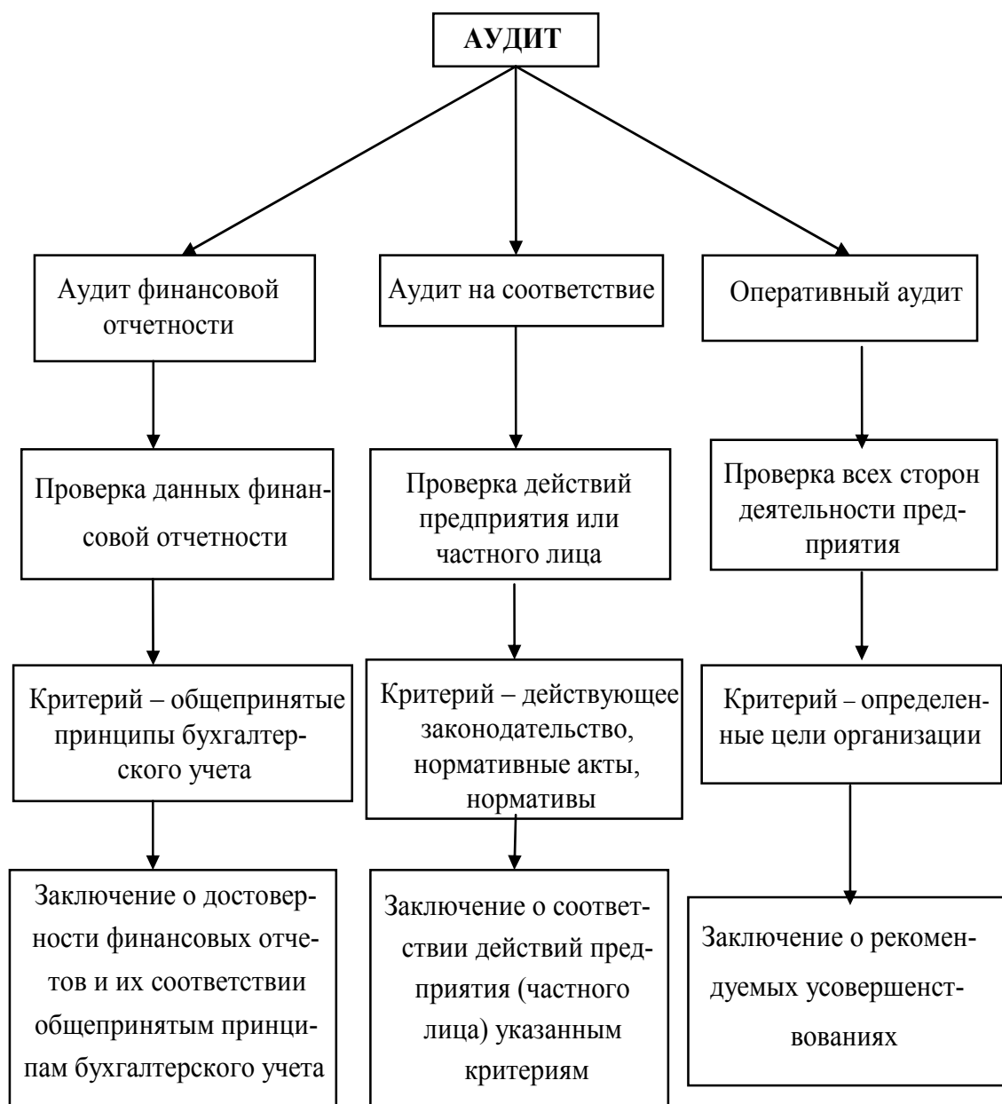
Рис. 1. Варианты аудита