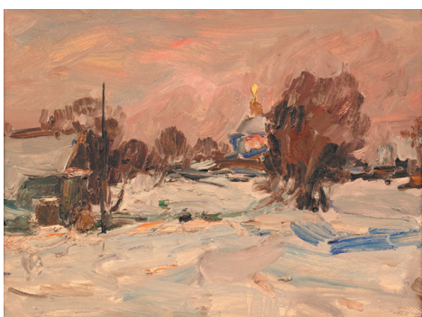
И. Сорокин. «Пейзаж»

90-летию со дня рождения народного художника России, лауреата Государственной премии РСФСР имени И.Е. Репина, действительного члена Российской академии художеств Ивана Васильевича Сорокина (1922–2004) посвящена экспозиция, представленная в залах Российской академии художеств.