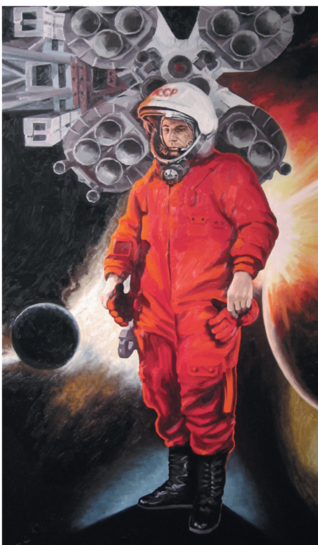
П. Ильин. «Юрий Гагарин» (правая часть триптиха)

Александр Кулемин известен графикой православного содержания. Им созданы серии цветных офортов, посвященных житиям святых, монастырям России, видам старинных русских городов. Кроме них он включил в экспозицию живописные этюды, сделанные