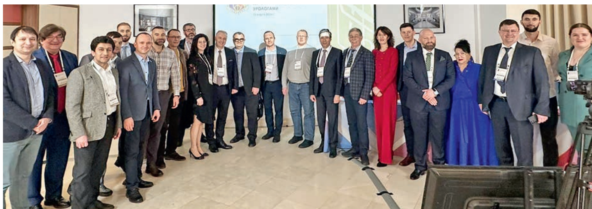
На конференции царил дружеская атмосфера

В ходе конференции постоянно сравнивались подходы в детской и взрослой урологии, обсуждались отдаленные результаты лечения и эффективность оперативных методик. Именно в такой тесной взаимосвязи стала возможна настоящая преемственность в лечении врожденных аномалий мочеполовой системы между детскими и взрослыми урологами.