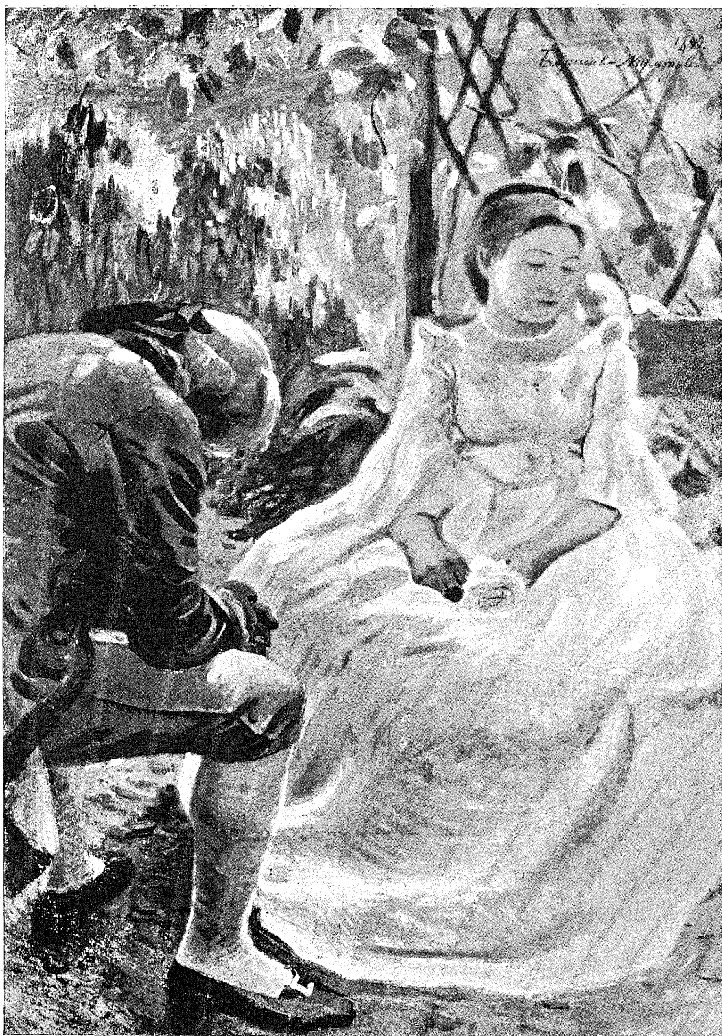
Осенний мотивъ. (1899.) Motif d'automne.