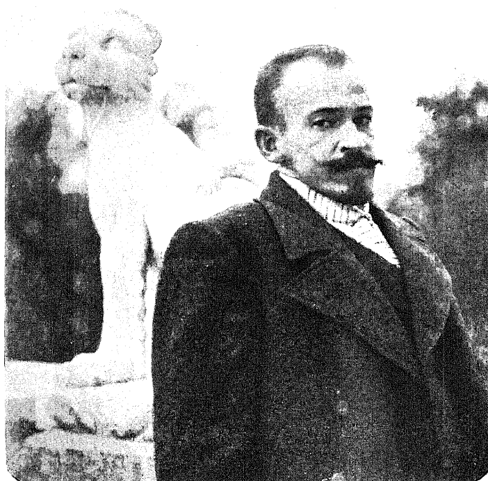
Портретъ художника. (Фот. снят. въ 1902 г.) Portrait du peintre. (Photogr. en 1902.)