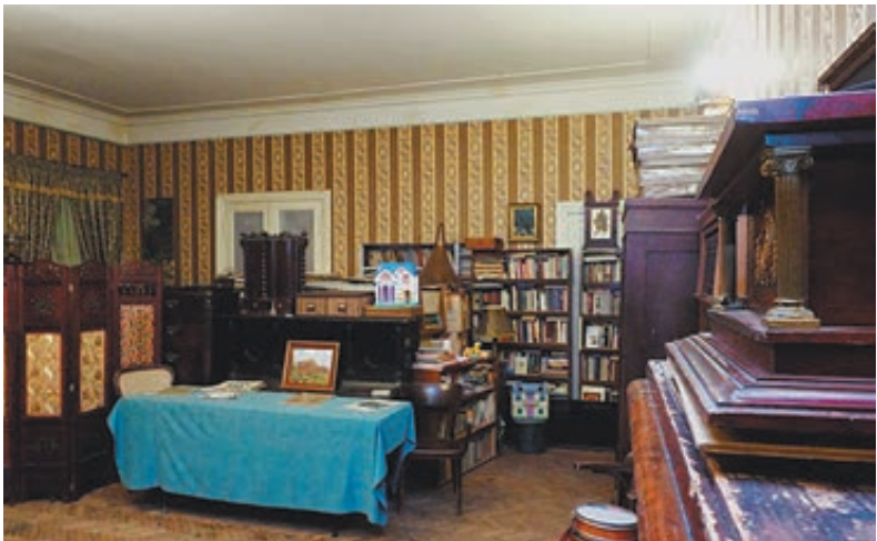
Дом Телешева меняет хозяев.

Московское городское отделение ВООПИиК располагается в Доме Телешева с 1975 года. Оно за свои деньги провело реставрацию погибавшего здания, занятого коммуналками и заводскими цехами, и легендарный особняк был превращен в один из культурных центров города. Однако затем лучшие отреставрированные помещения передали в пользу одной из фирм, близких к московскому правительству, а ВООПИиК была оставлена лишь часть помещений первого этажа и полузасыпанный подвал. Московское областное отделение ВООПИиК заняло одну комнату в Доме Телешева в 1998-м после того, как за свой счет отреставрировало и безвозмездно передало