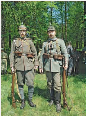
Прусские воины ▲ после боя

Участники реконструкции у памятника павшим в Первой мировой войне ▼