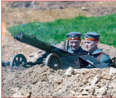
Баварцы с трофейным пулеметом ▲

Русские офицеры осматривают оружие после боя ▼