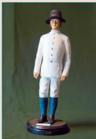
Матрос времен Петра I в бостроге из парусного полотна

Из альбома рисунков, снимков и фотографий Гвардейского экипажа. 1892 г.