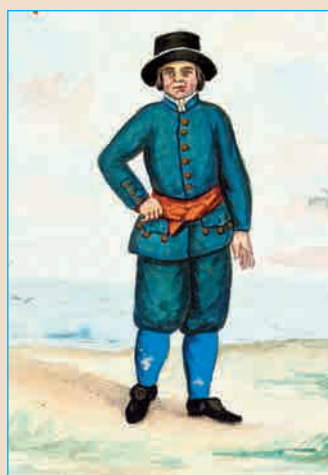
Матрос в суконном бостроге, 1711 г.