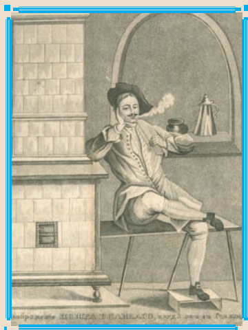
Петр I в матросском платье