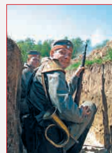
Рядовой и горнист 3-го Баварского пехотного полка