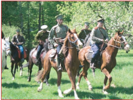
Русская кавалерия ▲