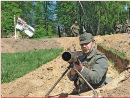
Прусский пулеметчик ▲