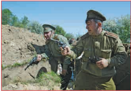
Полковник и штабс-капитан ▲ русской армии