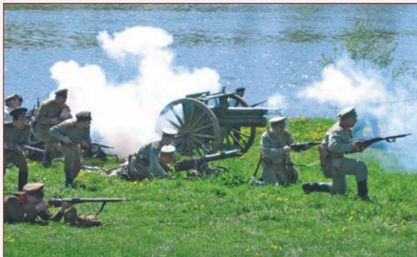
▲ Русские идут в атаку