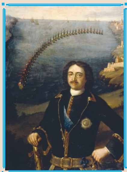
Портрет Петра I