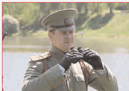
Штабс-капитан первой гренадерской артиллерийской бригады