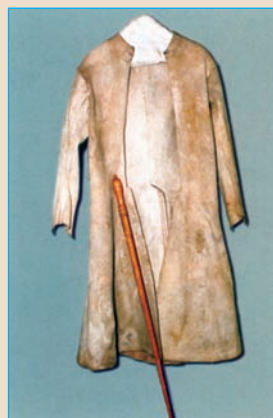
Рабочий колет и трость Петра I