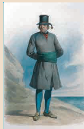
Одежда матроса в начале XVIII в.

Из альбома рисунков, снимков и фотографий Гвардейского экипажа. 1892 г.