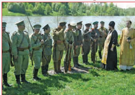
Молебн перед боем