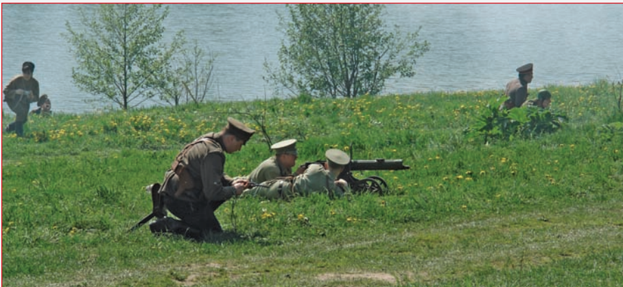
Русский пулеметный расчет ▲