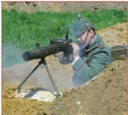
▲ Прусский пулеметчик с пулеметом «Льюис»