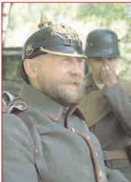
▲ Прусский солдат