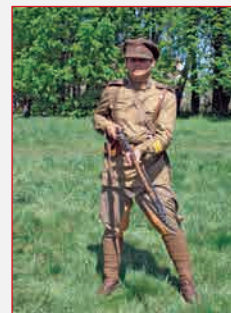
Русский пехотинец — рядовой ударных частей