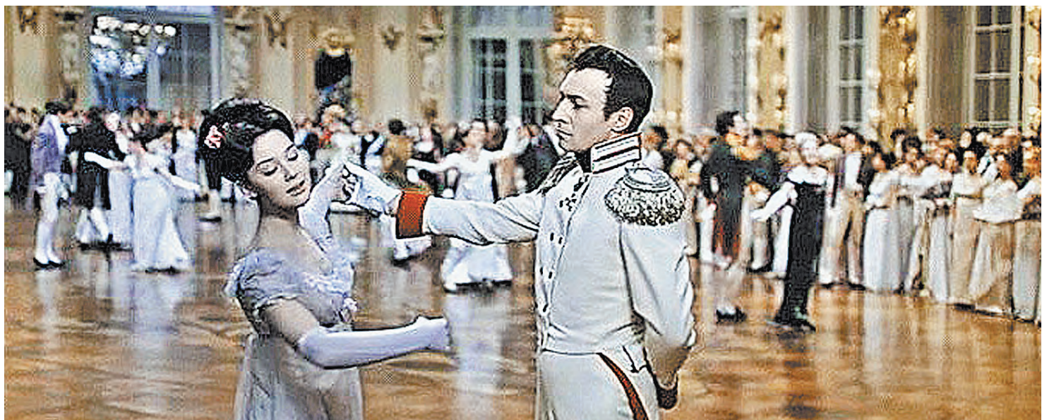
Роман Льва Толстого «Война и мир» можно не только читать, но и смотреть. Одна из самых известных мировых экранизаций сделана Сергеем Бондарчуком.

СОГЛАСНО опросу Левада-центра, все больше граждан РФ испытывают патриотические чувства. В 1996 году 81% граждан соглашались с высказыванием «В России происходят сейчас такие дела, что заставляют меня испытывать стыд за нее». В октябре 2014 года более 50% заявили, что стыдиться нечего. По мнению 85%, лучше быть гражданином России, чем любой другой страны. В 2014 году этого мнения придерживались 78%.