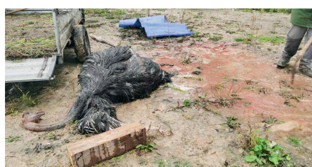
После гибели страуса и других питомцев владельцы фермы хотели заказать отстрел собак.

Настоящая война между владельцами животных диких и домашних — разгорелась в Серпуховском городском округе Подмосковья. Владелица приюта для собак обвинила в жестоком убийстве дворянских хвостов местной зоофермы. Между тем подозреваемые категорически отрицают свою причастность к инциденту.