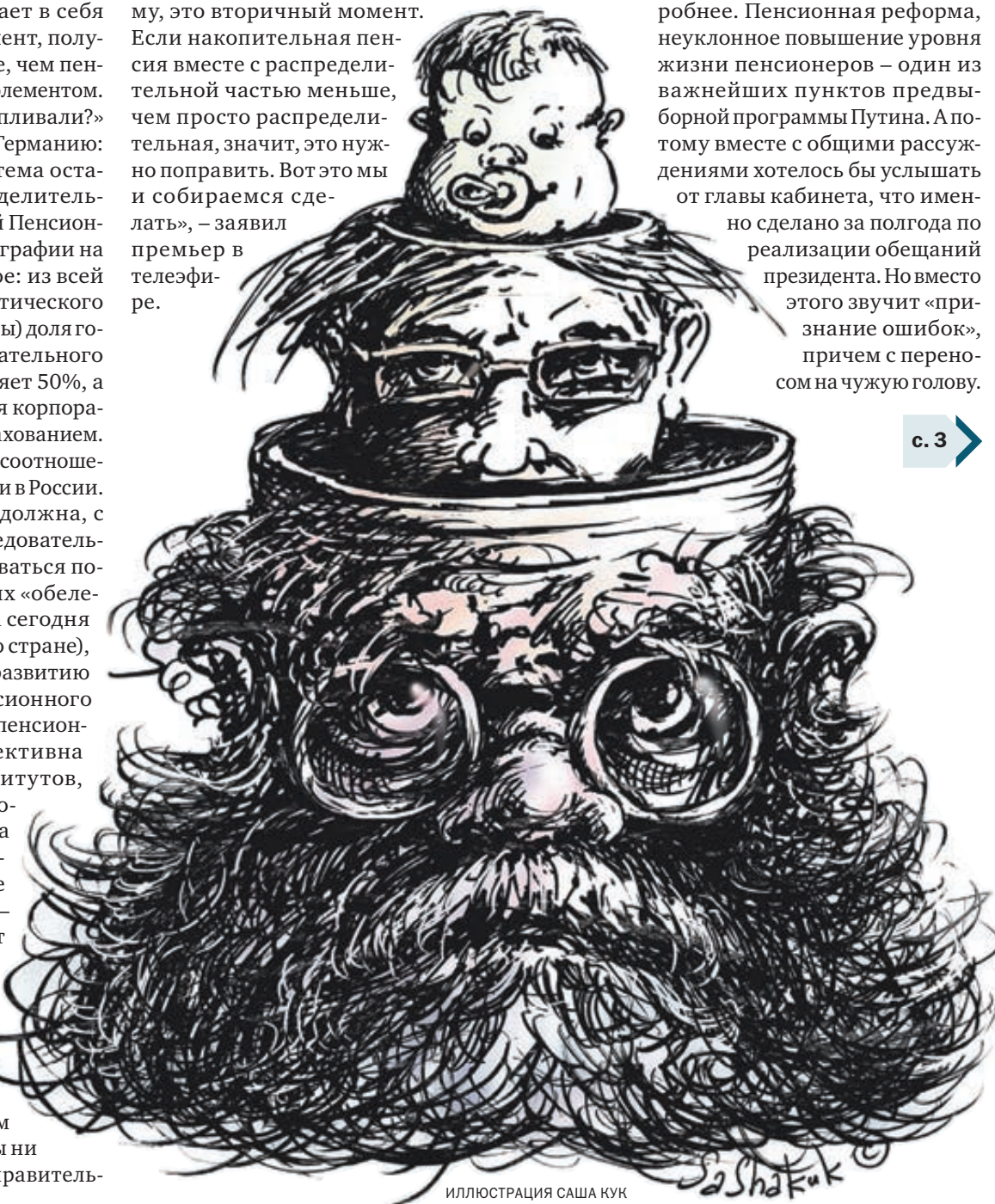
ИЛЛЮСТРАЦИЯ САША КУК

ство за то, что мы хотим сохранить распределительную систему, это вторичный момент. Если накопительная пенсия вместе с распределительной частью меньше, чем просто распределительная, значит, это нужно поправить. Вот это мы и собираемся сделать», — заявил премьер в телеэфире.