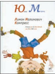
Мориц Ю. Лимон Малинович Компресс: Стихи. М.: Время, 2011. — 96 с.: ил.

3 Из сборника стихов Юнны Мориц дети и их родители узнают, как доблестный Артем Агапкин спас козу от летающего пирата, легко ли жить разбойнику на Луне, куда едет трамвай весны, кто такие Вагон Вагонович Вокзал и Дельфин Дельфиныч Винегрет, как обманула тетя Рита настоящего бандита и еще массу увлекательных вещей.