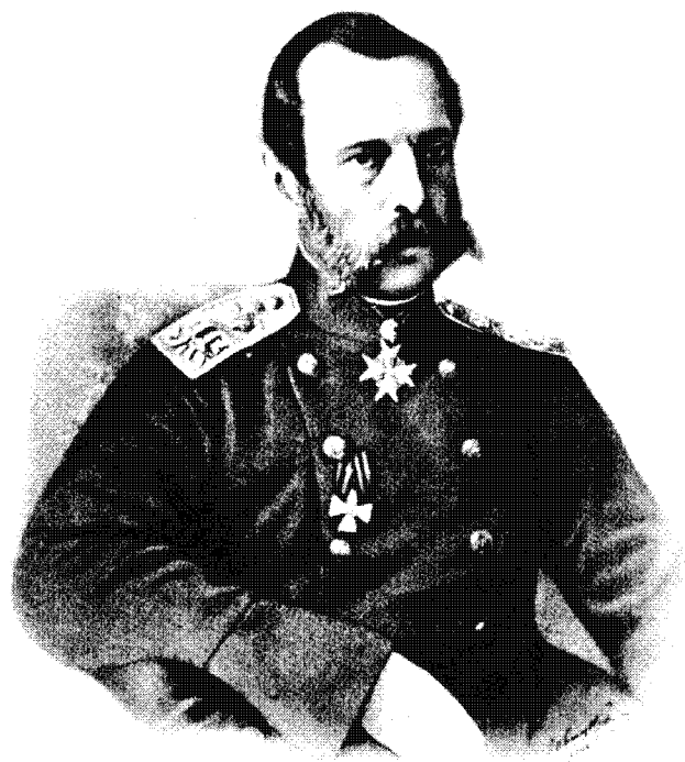
Государь Императоръ Александръ II.