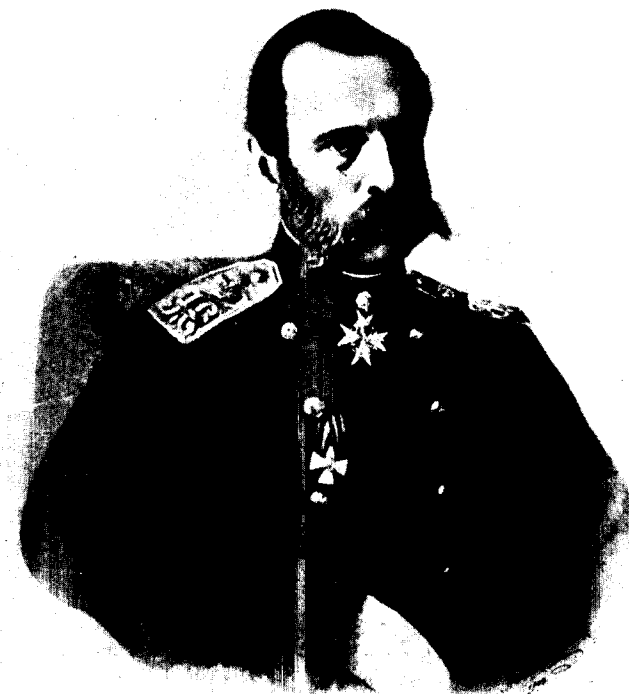
Государь Императоръ Александръ II.