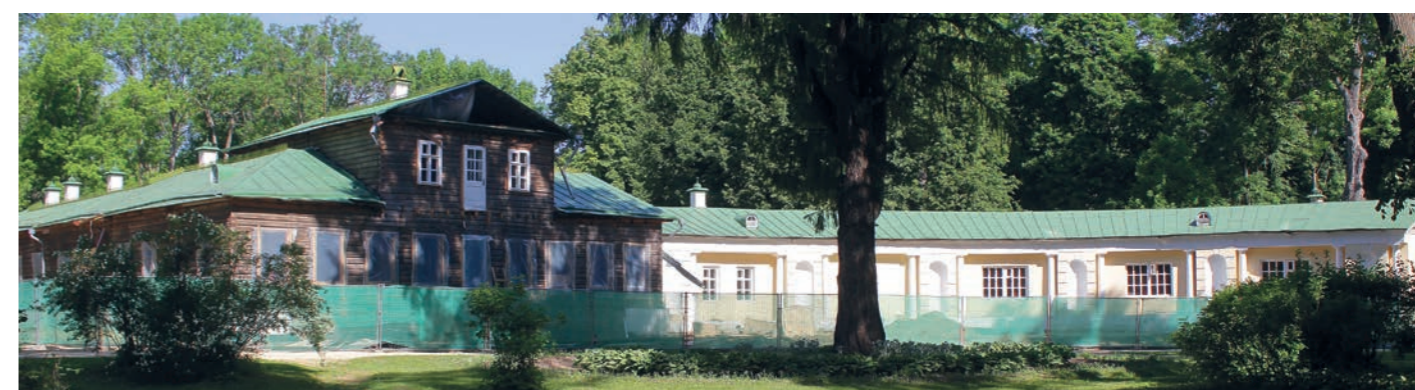
Спасское-Лутовиново родовая усадьба И.С. Тургенева