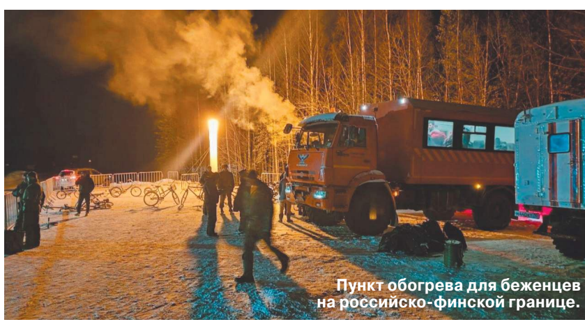
Пункт обогрева для беженцев на российско-финской границе.