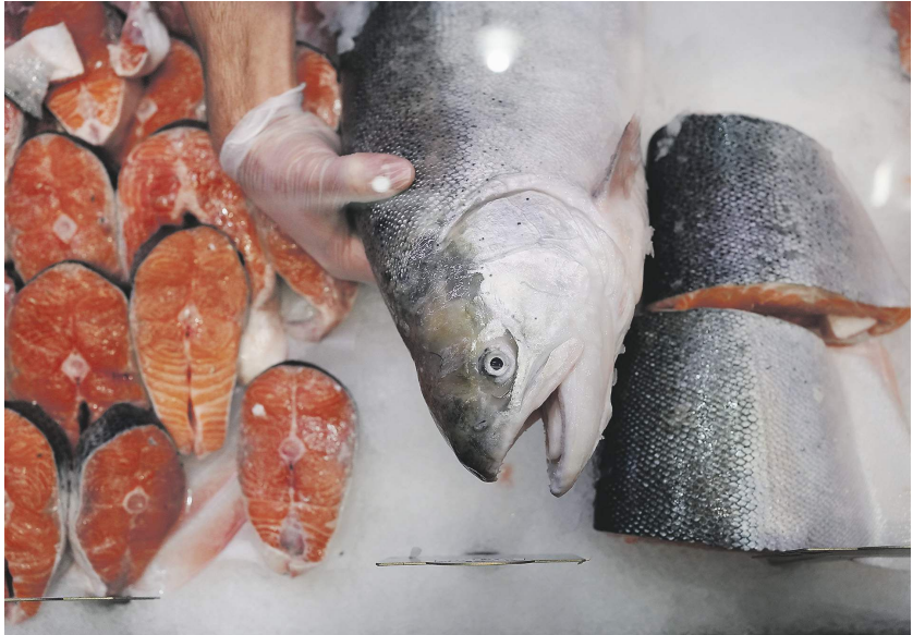
Дмитрий Корпачев / «Известия»