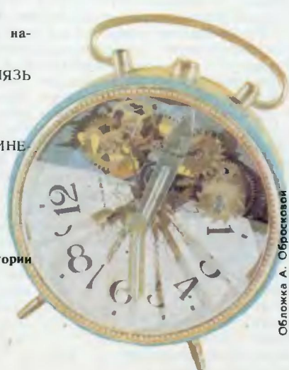
Обложка А. Обросковой