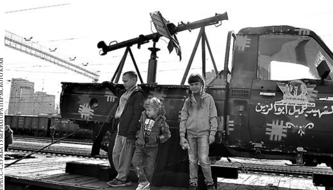
Пермь стала 42-м пунктом остановки в маршруте поезда с военными трофеями.