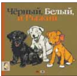
Усачев А. Черный, белый и рыжий. М.: Мелик-Пашаев, 2012. — 80 с. / Ил. С.Алдина.

6 «Собачьи» стихи и рисунки английского художника и писателя Сесила Алдина, впервые изданные в начале прошлого века, известны во всем мире. По мотивам его произведений написана новая книга Андрея Усачева. Вы не знали, что все щенки в душе поэты? Тогда знакомьтесь с Чернышом и его друзьями!