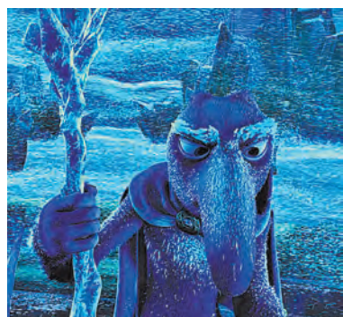
Один из героев сказки—Троль пришелся мировым зрителям по душе.

Мультфильм «Снежная королева 2: Перезаморозка» (режиссер Алексей Ццилин) — продолжение первой части франшизы воронежской студии Wizard Animation «Снежная Королева». Первая часть уже выпущена в 65 странах. В российский прокат «Снежная королева 2» выйдет 1 января 2015 года. Одновременно анимационный фильм выйдет в Великобритании, Польше, Израиле, Южной Кореи, странах СНГ и Ближнего Востока.