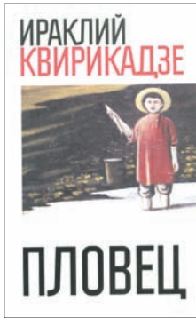
Квирикадзе И. Пловец: Сб. повестей. М.: РИПОЛ КЛАССИК, 2010. – 320 с. – (Нет такого слова). 5000 экз. (п) ISBN 978-5-386-01900-6

Размах книги Ираклия Квирикадзе включает в себя не одну только Грузию. Его герои совершают поистине титанические подвиги. Ну, или гераклические. Например, переплывают не