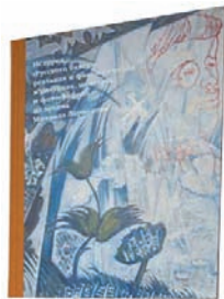
История «Русского балета», реальная и фантастическая. М.: Издательская программа «Интерроса», 2010. – 432 с. – (Первая публикация).

2 В этом необычайно интересном и очень изобретательно оформленном издании представлены рисунки, эскизы костюмов и декораций, фотографии и мемуары из архива художника Михаила Ларионова, посвященные легендарному «Русскому балету» Дягилева. Архивные материалы сопровождают комментарии, составленные по свидетельствам создателей и участников спектаклей.