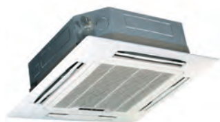
Фанкойлы всех типов; 2, 4-трубные

Кроме того, в модельном ряду LESSAR PROF :