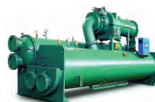
Винтовые и центробежные водоохлаждаемые чиллеры