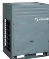
Компрессорно- конденсаторные блоки