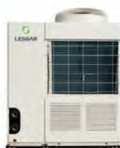
Модульные и мини-чиллеры