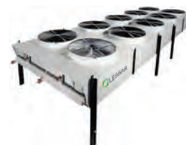
Конденсаторы и сухие охладители