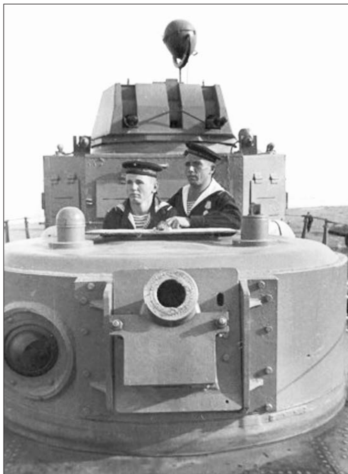
Орудийная башня советского бронекатера проекта 1125