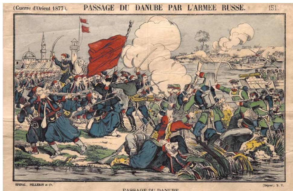
«Форсирование Дуная Нижнедунайским отрядом русской армии. 10 июня 1877 г.» Литография (Франция)

Материалы на 2-й полосе подготовил Олег ТОРЧИНСКИЙ