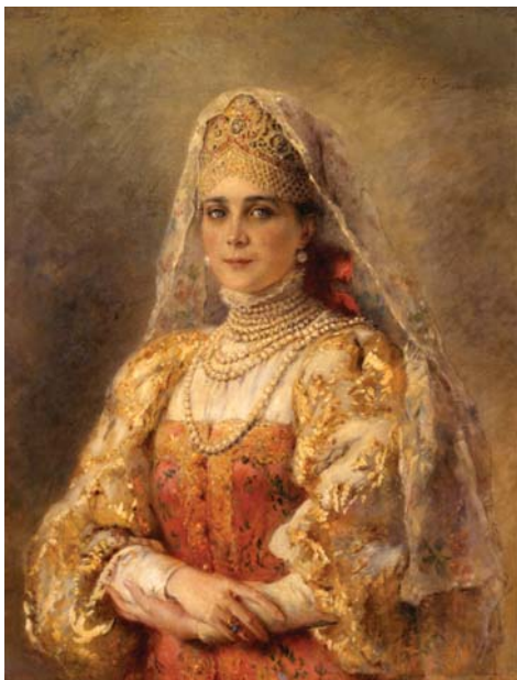
К. Маковский. «Портрет княгини З.Н. Юсуповой, графини Сумароковой-Эльстон». 1895. ГИМ