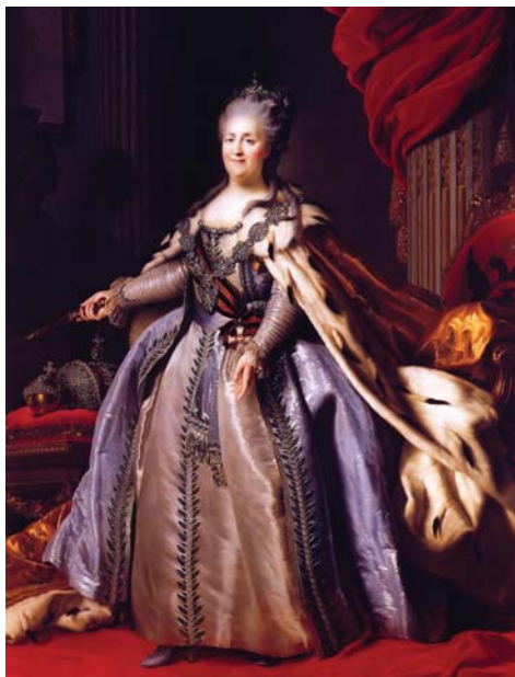
Ф. Рокотов. «Портрет императрицы Екатерины II». Конец 1770-х гг. ГИМ