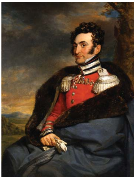
Джордж Доу. «Портрет генерал-майора В.И. Каблукова, участника Отечественной войны 1812 г. 1825. ГИМ