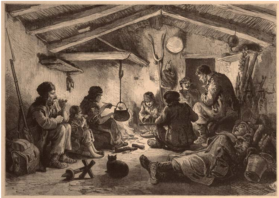
«Русские солдаты на постое в болгарской семье»