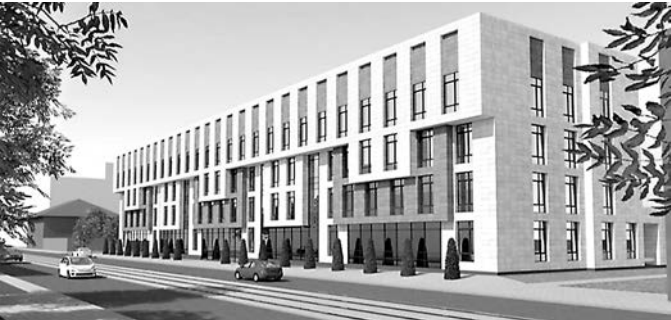
В сутки новая поликлиника сможет принимать до 400 пациентов.

в том числе 10 поликлиник, семь больниц, четыре сельские врачебные амбулатории и один диспансер. Иван Соломин