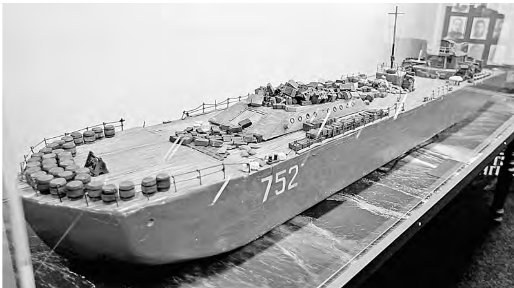
ЦЕНТРАЛЬНЫЙ ВОЕННО-МОРСКОЙ МУЗЕЙ

К 80-летию начала блокады Ленинграда музей «Дорога жизни» представил расширенную экспозицию, рассказывающую о самой масштабной трагедии за всю историю перевозок по Ладожскому озеру. В ночь с 16 на 17 сентября 1941 года во время вражеского обстрела и девятибалльного шторма затонула баржа № 752. Погибло до полутора тысяч человек. Большинство находившихся на борту были молодыми людьми — курсантами и учащимися. В музее представлен большой макет баржи и фотографии тех, кто был на ней в тот роковой рейс.